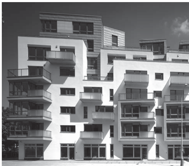
V kategorii Novostavba bytového domu získal cenu bytový dům na Nedvědově náměstí v Praze-Podolí od autorů J. Šafera, O. Hájky, L. Fescu a T. Pavlíka.

Bytový dům v Podolí je příkladem úspěšného využití různých zbytkových ploch přímo v širších městských centrech. Vyrostl na místě dočasné zástavby a kompaktní formou dotvořil městský blok – základ standardní městské struktury. Důsledné je využití vlastností a možností staveniště, maximální výtěžnost pozemku bez překročení kapacitních možností.